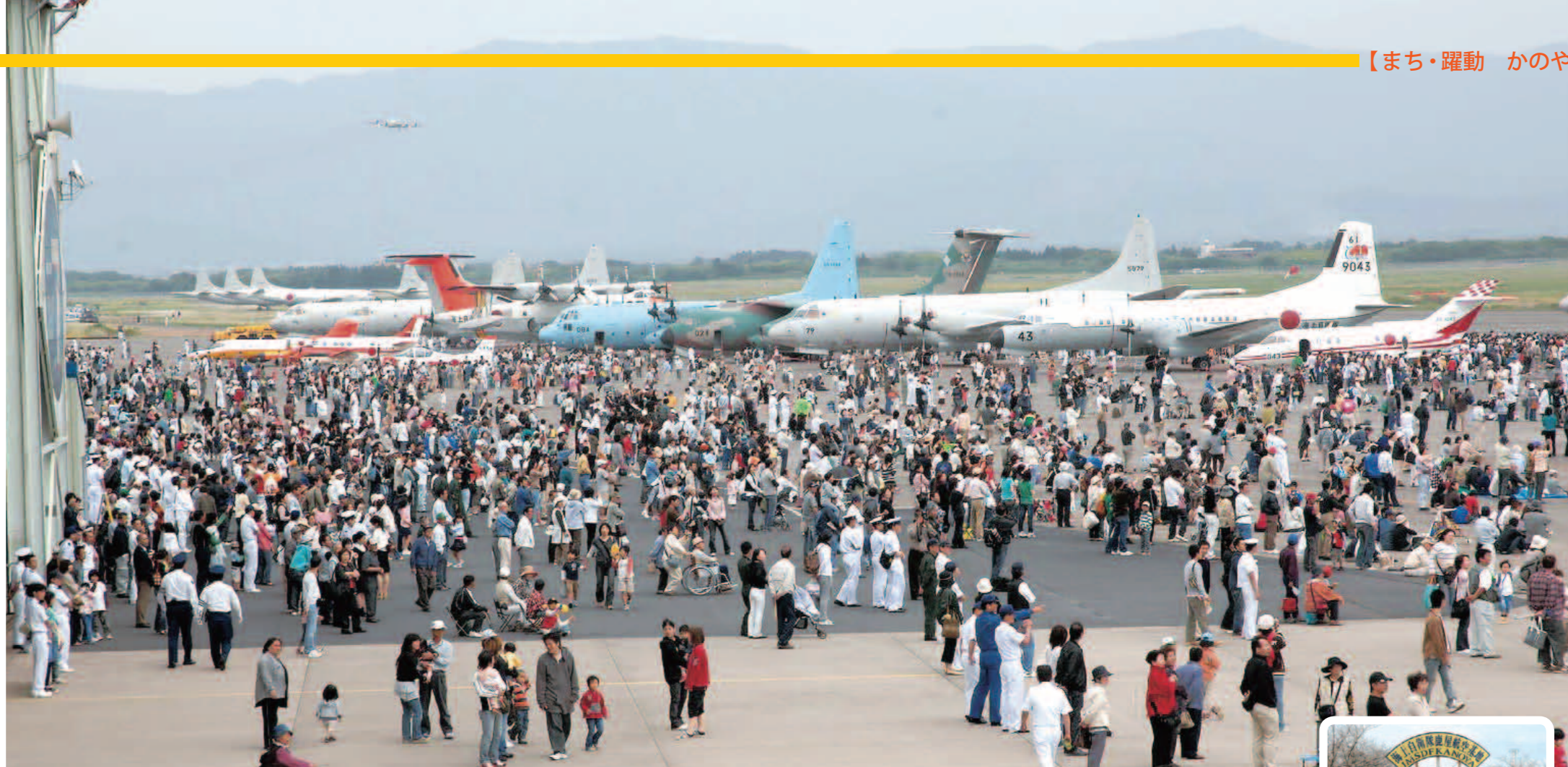
エア・メモリアル in かのや