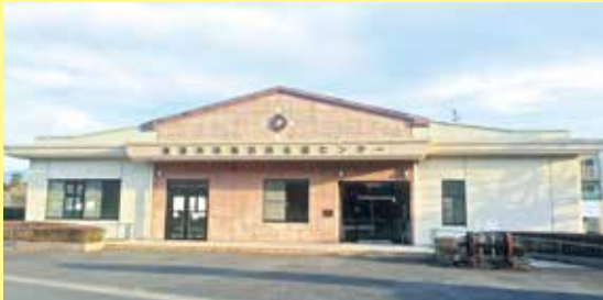
吾平町鉄道資料館跡