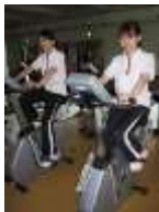
自転車 エルゴメーター