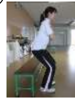
下肢筋力 (イス立ち上がり)