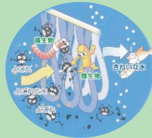
ひもによる浄化のイメージ