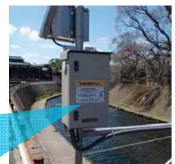
案内看板を設置しています