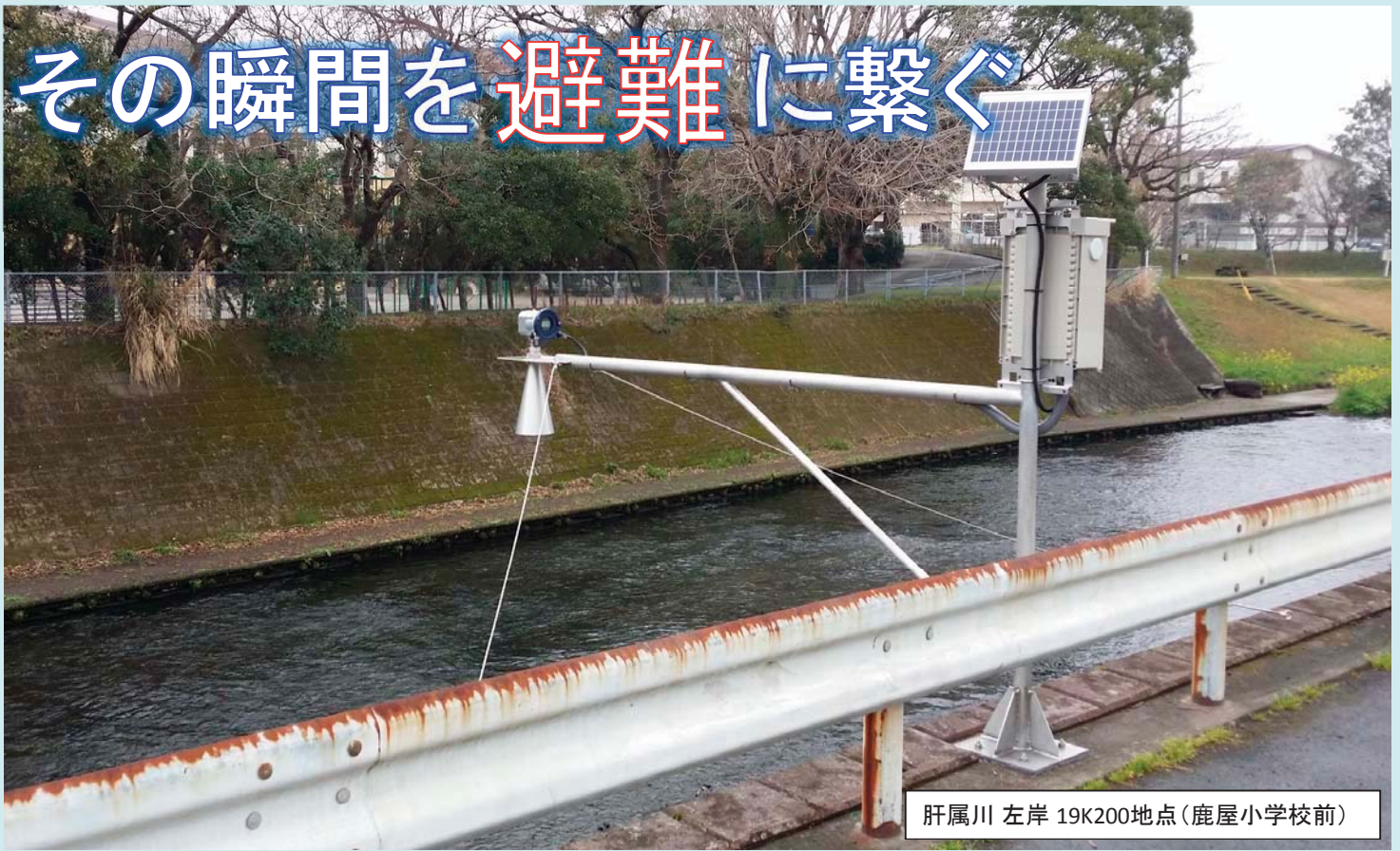
肝属川 左岸 19K200地点(鹿屋小学校前)