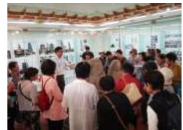
〔隼人塚史跡館での学び〕

長寿大学では引き続き、受講生を募集しています。 問合せ先：上小原分館 ☎63-2883 次回は 9月18日(水) 串良公民館で三館合同の「省エネ講座」です。