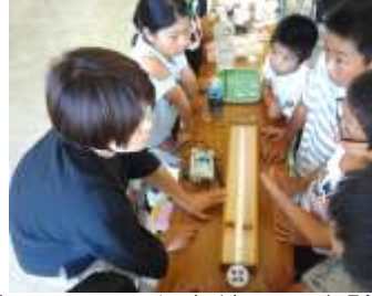
〔モノコードを使って実験〕