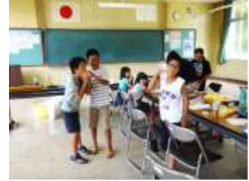
〔糸電話で学んだ事を復習〕