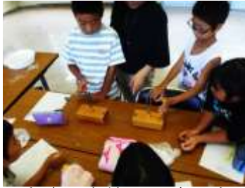
〔音叉を使って確認〕