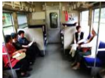
〔久しぶりの汽車移動〕