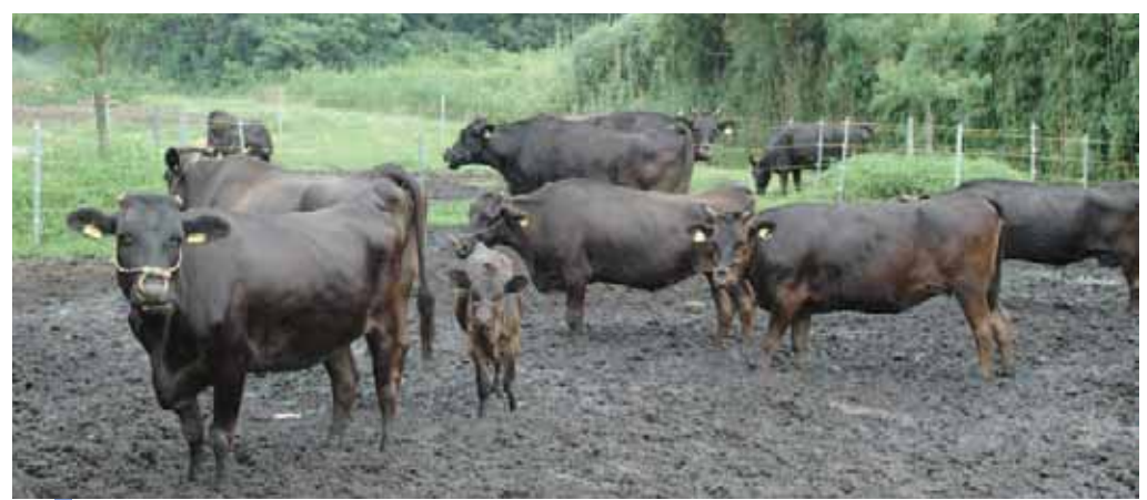
高い品質を誇る鹿屋の黒毛和牛