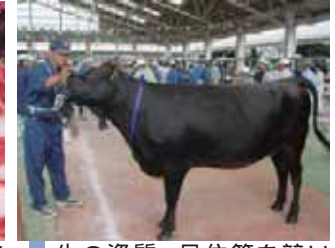
牛の資質・品位等を競い合う共進会