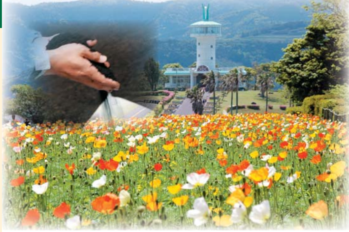
「サン・アグリかのや」と「サン・プレスかのや」は、霧島ヶ丘公園でも使用されています。

今後この目的達成に努め、また、安定した品質の、環境に優しい堆肥を製造し、鹿屋市の農畜産業振興に取り組みます。 【問い合わせ】 鹿屋市畜産環境センター ☎0994-42-1131