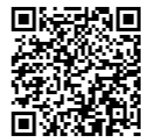
※QRコードは、 （株）デンソーウェブの登録商標です。