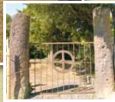
鹿屋市文化課 花岡島津氏歴代墓地