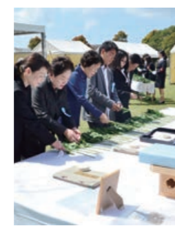
▲畜産まつり恒例の抽選会

第61回旧鹿屋航空基地特別攻撃隊戦没者追悼式 内容||太平洋戦争で特別攻撃隊として国難に殉じた英霊を慰霊し、平和を祈念する追悼式 日時||4月7日(土) 10時30分~12時 場所||小塚公園慰霊塔前広場 ※荒天時は市体育館 鹿屋福祉政策課(1階⑨番窓口) ☎ 0994-31-1113